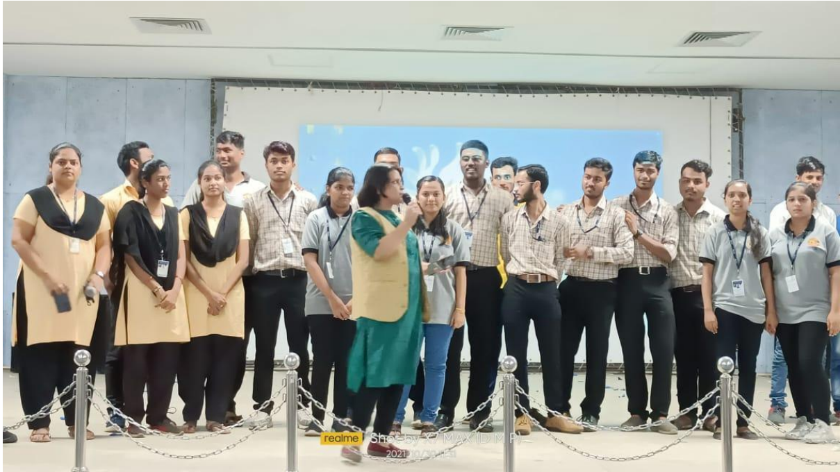
Proper body language demo session on 2 nd July, 2018